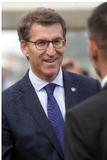
Alberto Núñez Feijoo - Presidente de la Xunta de Galicia